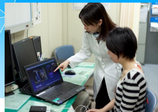
心療内科で経験できる疾患の分布